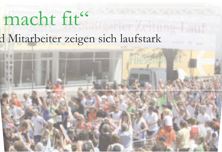
Rund 3000 Sportler, überwiegend aus Stuttgart und der Region, nahmen am 10-Kilometer-Lauf des Stuttgarter-Zeitungs-Laufs 2011 teil.