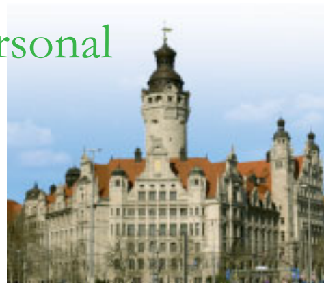
Die Teilnehmer des diesjährigen AKAD-Gesprächskreises Personal trafen sich im Neuen Rathaus von Leipzig.